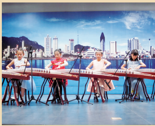
古箏齐奏 茗源艺术中心