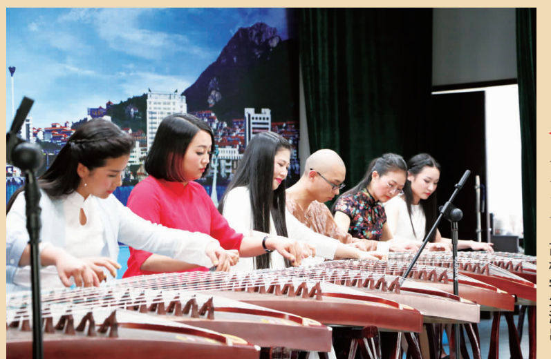
古箏齐奏 高校学生演出