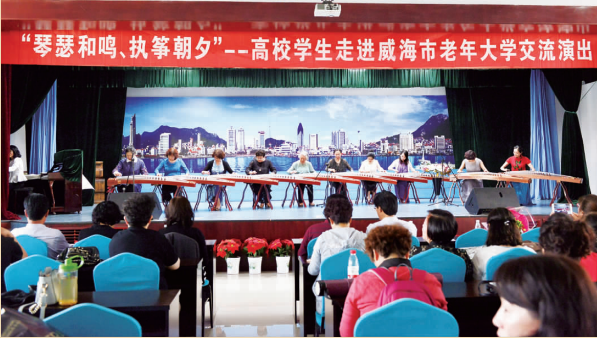
古箏齐奏 二班演出