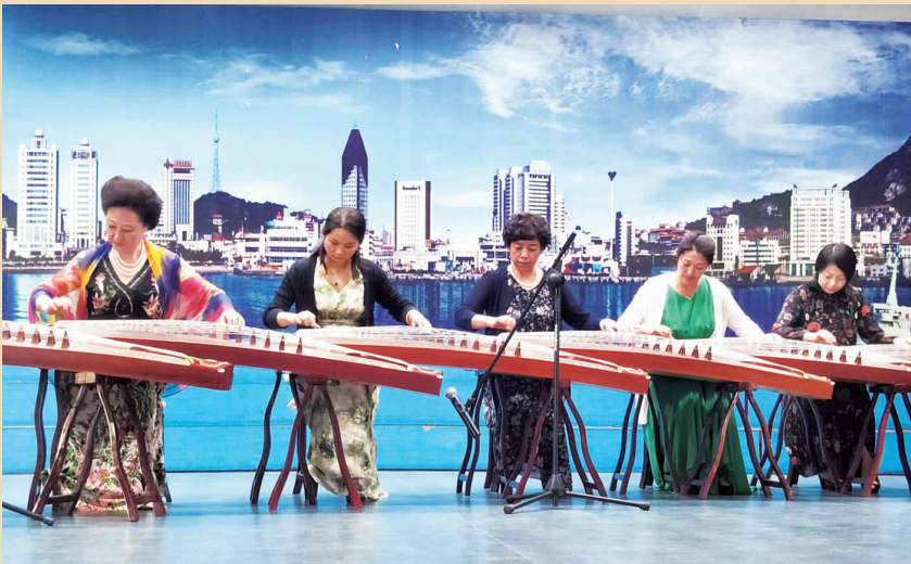
古箏齐奏 三班演出