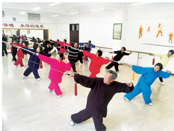
太极拳2014级2班学员在上课