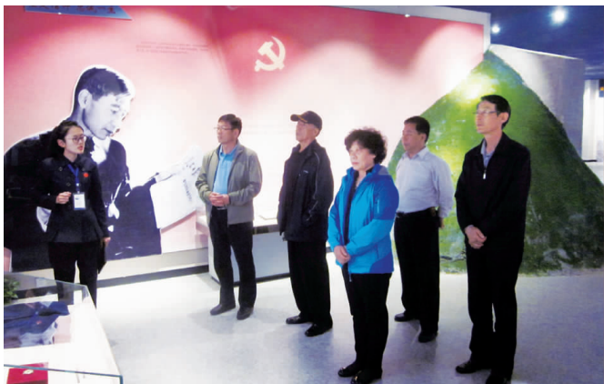
参观郭永怀事迹陈列馆

近日，市委老干部局为让退下来的老同志亲身感受全市老干部工作发展变化和主要成果，进一步坚定老同志凝心聚力促发展的信心，组织他们深入基层进行参观考察活动。市委离退休干部工委副书记周承涛、市委老干部局市直科科长包西刚陪同考察。